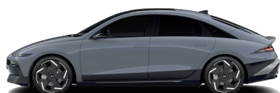
Transmission Blue – Perleťová 760 €