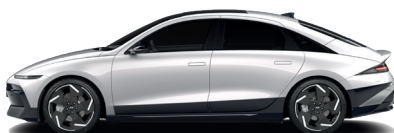
Curated Silver – Metalická 760 €