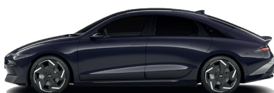
Biophillic Blue – Perleťová 760 €