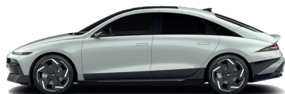
Celadon Gray – Metalická 760 €