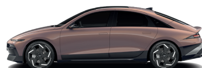
Sunset Brown – Perleťová 760 €