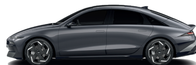
Nocturne Gray – Metalická 760 €