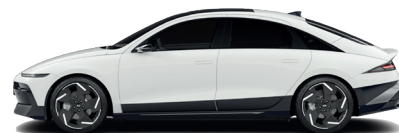
Serenity White – Perleťová 760 €