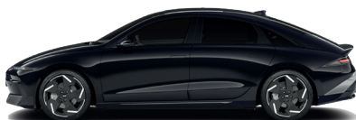
Abyss Black – Perleťová 760 €