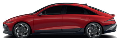
Ultimate Red – Metalická 0 €